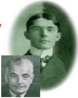
John B. Watson